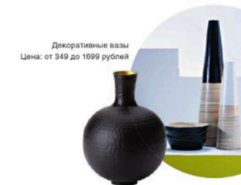
Декоративные вазы Цена: от 349 до 1699 рублей