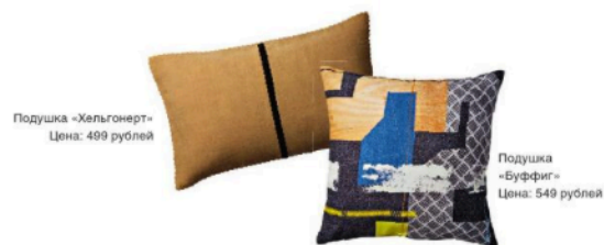
Подушка «Хельгонерт» Цена: 499 рублей

«Сразу хочу сказать несколько слов об Ikea: этот гигант постоянно развивается, и многие его предметы по стоимости и уровню стиля уже почти не уступают ведущим мировым брендам. Иногда даже закрадывается сомнение: дизайнеры Ikea едут за вдохновением на Salone Del Mobile или весь Милан уже в Эльмхольте? О том, как правильно сочетать мебель и предметы интерьера разных ценовых сегментов, могу сказать одно: сочетать их, безусловно, можно, но нужно строго следить за пропорциями и акцентами. Рассмотрим это на конкретных примерах. Если речь идет о домашнем интерьере, то важно запомнить простое правило: бренды ставим на самое видное место, остальные же — в тень, в окружение. Аналогично поступают в музеях, светом выделяя шедевр из «работ раннего периода» мастера, и в театрах с яркой, обособленной императорской ложей. Пусть единственный дорогой предмет интерьера станет своего рода сердцем пространства, пусть вокруг него собираются гости, пусть в нем хранится самое ценное или пусть он будет уголком уюта.