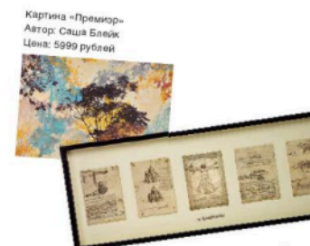
Картина «Премиер» Автор: Саша Бляк Цена: 5999 рублей