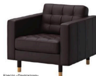
Кресло «Ландскруна» Цена: 27 590 рублей