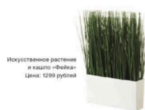
Искусственное растение и кашпо «Фейжа» Цена: 1299 рублей