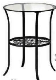
Придиванный столик «Клингсбю» Цена: 1299 рублей