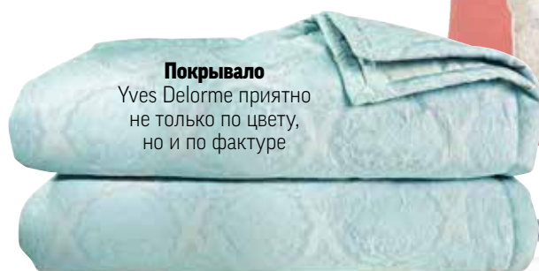
Покрывало Yves Delorme приятно не только по цвету, но и по фактуре