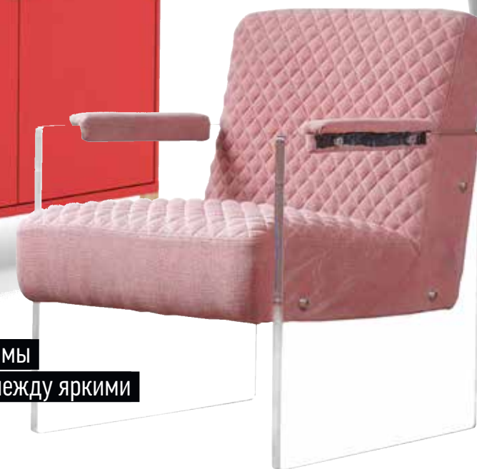
Кресло Living смотрится облегченно благодаря прозрачным боковым стенкам