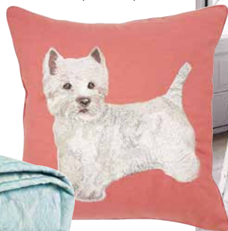
Декоративная подушка Yves Delorme будет вызывать умиление у гостей