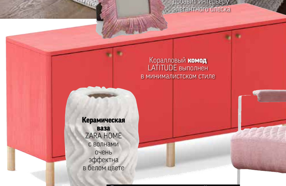
Керамическая ваза ZARA HOME с волнами очень эффектна в белом цвете