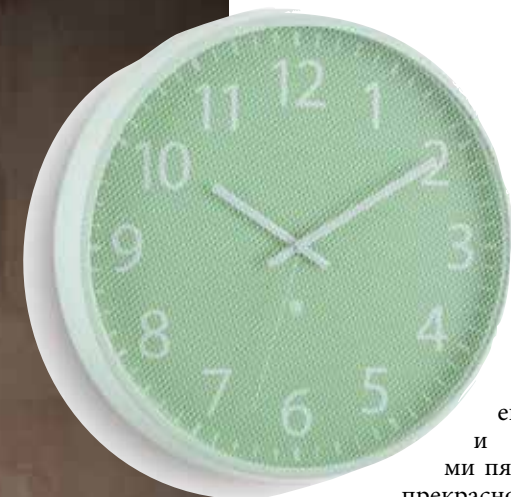
Металлическая сетка на циферблате настенных часов Perftime создает интересный оптический эффект

о цветовой гамме интерьера. В интерьере пастельных тонов необходимо расставлять акценты, дополнять его более глубокими и сочными цветовыми пятнами — например, прекрасно будет смотреться бордовый текстиль на фоне персиковых стен или аксессуары цвета хаки на фоне пастельного желтого. Главное — соблюдать баланс яркости и нежности. Сочетание теплых пастельных оттенков с холодными также возможно. Например, шторы розового цвета могут «подружиться» с мебельной обивкой голубого оттенка. Такой мягкий контраст выглядит очень изысканно. Чтобы интерьер не выглядел слишком лаконичным или даже инфантильным, стоит поиграть с фактурами. Интересный эффект получится от сочетания пастельных тонов с древесной структурой, потертостями и бархатистыми поверхностями. Несомненное преимущество пастельных оттенков — это их способность адаптироваться к любому интерьерному стилю. Особенно гармонично они смотрятся в стиле прованс, кантри, шебби-шик, а также в классических интерьерах.